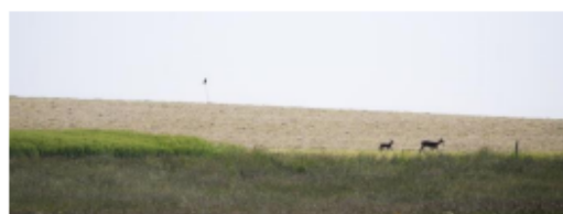
Prairie extensive et culture traversées par des chevreuils